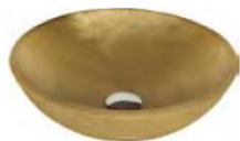
Gold (Blattauflage 3D) CIRCUS43FLFO